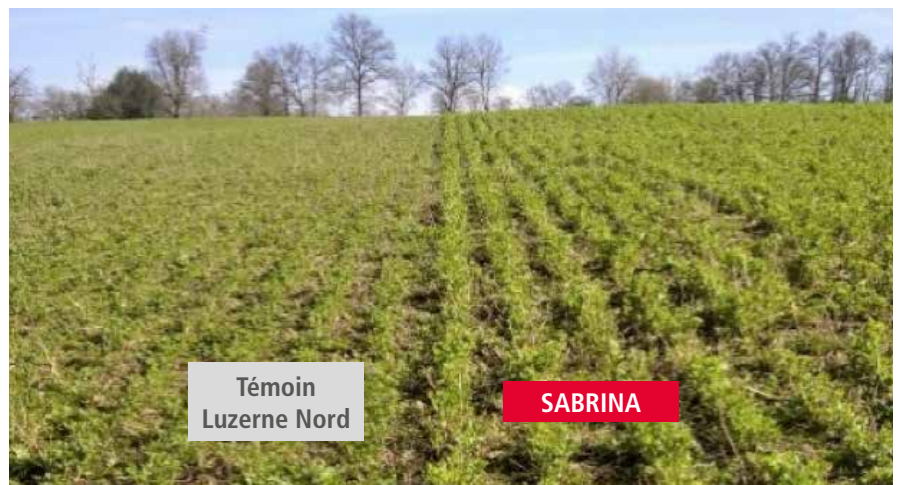
Témoïn Luzerne Nord

SABRINA présente un port très dressé et une belle hauteur de végétation.